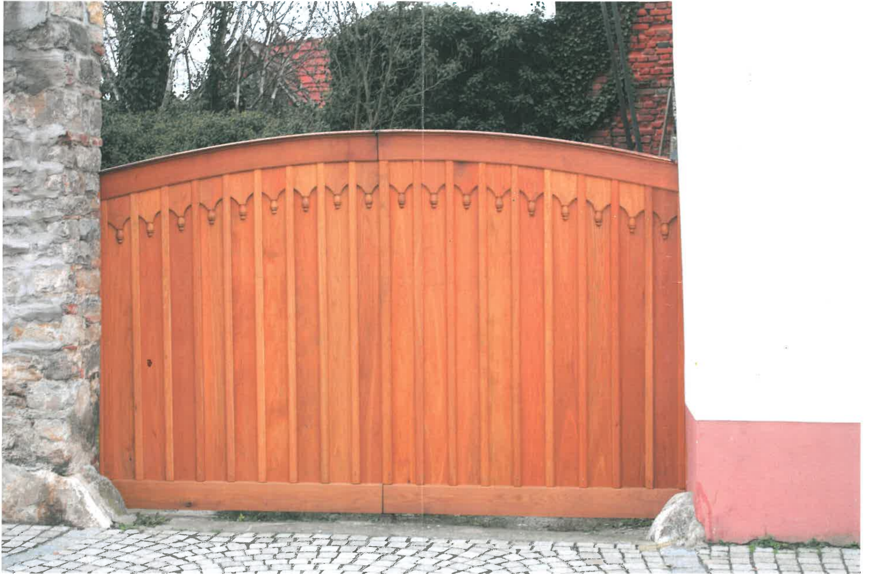
das neue Tor, ein Schmuckstück